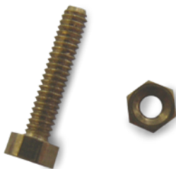
Standardschraube D=1,2mm (Aufbauanleitung Punkt 11) Standard screw D=1.2mm (Assembly Instruction Point 11)