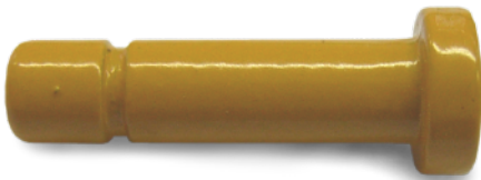
Bolzen 3,9 x 17mm (Aufbauanleitung Punkt 6) Pin 3.9 x 17mm (Assembly Instruction Point 6)